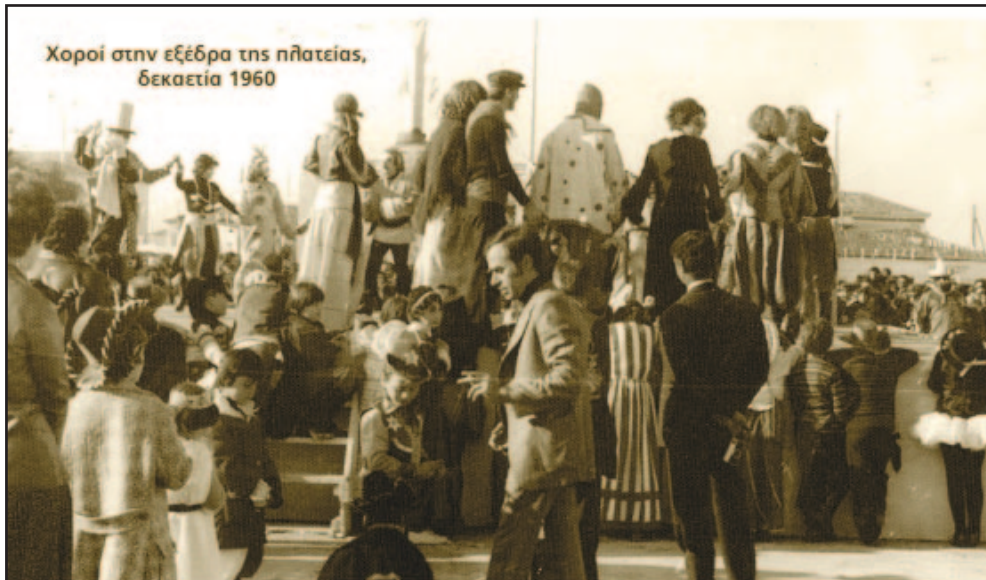
Ελλείπει σχετικής φωτογραφίας, χορός στην κεντρική πλατεία τη δεκαετία του 1970

χώρο που βρίσκεται σήμερα το πάρκινγκ βορειώς του πάρκου αλλά στη συνέχεια το σχέδιο άλλαξε και το σχολείο κατασκευάστηκε στη σημερινή του θέση. Γράφει λοιπόν ο Λουκάκος: “Σπανίζουν πράγματι τέτοιες επιτυχίες σε χοροεσπερίδες σαν την προχθεσινή του Σαββάτου που δόθηκε στην αίθουσα “Τιτάνια” υπέρ της θεμελιώσεως διδακτηρίου στο Νησί. Την σπάνια αυτή επιτυχία την αποδίδουμε σε δύο παράγοντας: Ο πρώτος είναι το κορύφωμα κόπων των συμπαθών μας εκπαιδευτικών της στοιχειώδους της πόλεώς μας. Ο δεύτερος είναι η πλήρης κατανόησης του ιερού σκοπού για τον οποίο εδίδετο η χοροεσπερίς, ευχάριστον δηλαδή φαινόμενον, το οποίο φανερώνει πως ο πολιτισμένος κόσμος επικροτεί κάτι το ευγενές, κάτι το απαραίτητον που πρέπει να γίνη στον τόπον του. Εκείνο δε εν ολίγοις που διεπίστωσα το προχθεσινό βράδυ, είναι η υλική και ηθική προθύμως συμπαραστάσεις των κατοίκων του Νησιού δίπλα από τους δημιουργούς της προχθεσινής βραδυάς αγαπημένους μας εκπαιδευτικούς. Να γιατί πρόθυμα τα καταστήματα της πόλεως που αν και διανύουν την κρισιμωτέραν ανεργίαν προ-