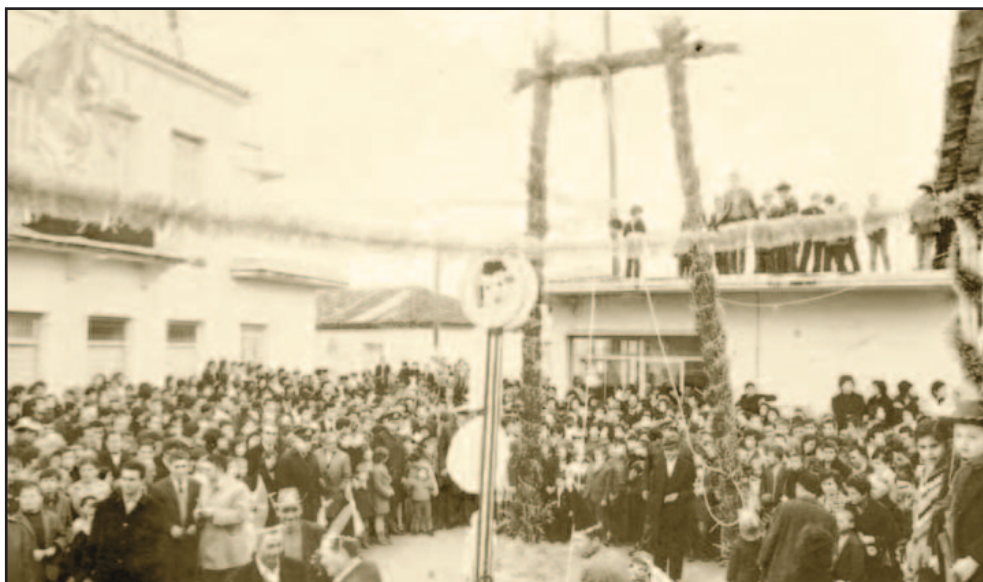
Κρεμάλα τέλη της δεκαετίας του 1960

φυλάσσει. Η τεχνική της τραμπάλας/κρεμάλας των σκύλων φαίνεται ότι είναι η ίδια παντού. Ο θάνατος του ζώου δεν είναι απαραίτητος, πιο σημαντικό φαίνεται να είναι το τρομερό ουρλιαχτό που έχει ως συνέπεια το διώξιμο των δαιμόνων (και να μην ξεχνάμε ότι και οι καλικάντζαροι εμφανίζονται με τη μορφή σκύλου). Η γεωγραφική εξάπλωση του έθιμου δεν φαίνεται να έχει κάποιο ιδιαίτερο ειδικό βάρος, αντιθέτως οι αναφορές είναι τόσο λίγες που δεν μας επιτρέπουν να χαρακτηρίσουμε το έθιμο πανελλαδικό. Υπάρχει μια αντίφαση ανάμεσα στην τιμωρία και στο γεγονός ότι ο σκύλος είναι κατοικίδιο ζώο και μάλιστα φύλακας. Φαίνεται αταίριαστη μια τέτοια συμπεριφορά απέναντι σε αυτό το χρήσιμο ζώο και ακριβώς αυτή η “παράλογη” διαφορά στη συμπεριφορά μαρτυρά ότι το έθιμο έχει ένα επίπεδο ερμηνείας που δεν μπορεί να προσδιοριστεί με τη λογική”.